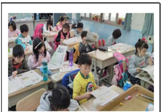
小朋友專心的讀報