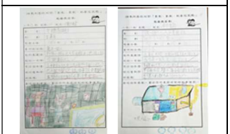
行天宮閱讀學習單