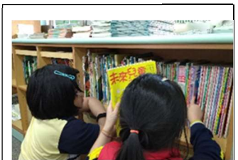
孩子們最愛在班級書櫃裡尋寶

我在班級書櫃裡，放置許多適齡閱讀的書籍，除了繪本外，還有未來兒童、康軒學習雜誌初階版、新小牛頓等兒童雜誌，教室如同微型圖書館，孩子們會利用晨間、下課或零碎時間閱讀，有些搶手的書籍，孩子們彼此還會預約借閱呢！