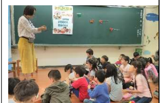
到故事屋聽故事，一 起手做「毛根蜘蛛」