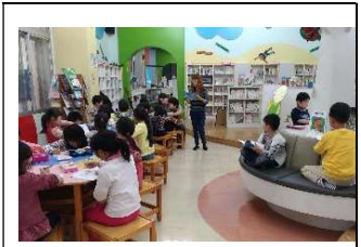
小朋友參觀圖書館， 了解借閱相關規定。

本班小朋友均希熱愛閱讀，不僅在校內外圖書館借閱不少書籍，在撰寫讀書心得上也非常用心，連續兩年都獲選閱讀校楷模。