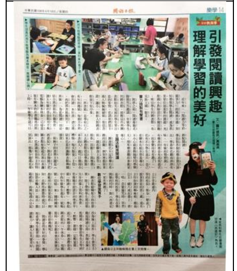
108 年 4 月 18 日

◎請依據 107 學年度閱讀成果調查填入以下數據：(統計期間：107.8.1~108.3.31)