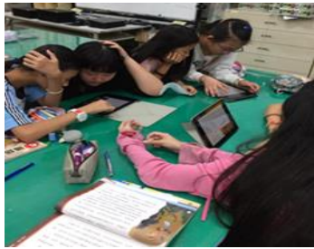
閱讀理解策略課程