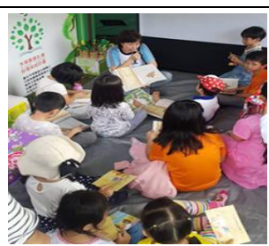
國家圖書館主辦臺灣閱讀節