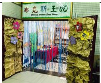
圖書室場佈花果山水瀛洞