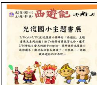
西遊記主題書展宣傳