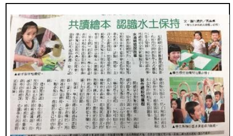
107 年 12 月 13 日