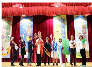
校長主任領銜演出