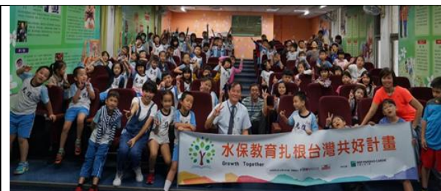
城邦文教基金會推廣水土保持活動