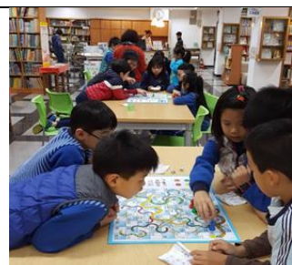
桌遊蛇棋融入閱讀