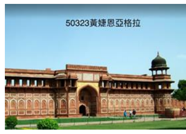
Google 地圖探索學生作品