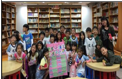
二年級學生完成十大分類法大海報

四、 成立粉絲專頁 ：在 facebook 成立「布克斯王國粉專和全校親師生即時分享圖書室各項活動，及閱讀課程進行方式，達到推廣宣傳效果。