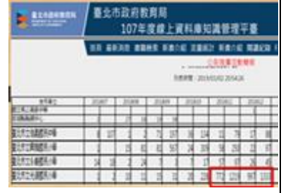
線上資料庫達到 1355 次數