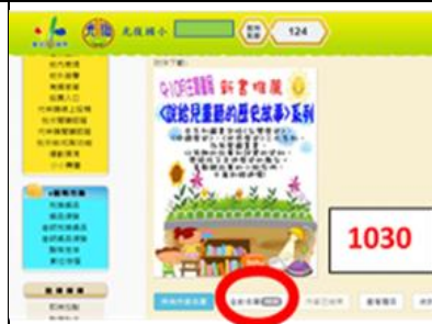
e 酷幣參與人數達 1030 次