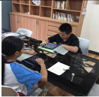
五年級學生錄製共讀書

台 iPad 閱讀故事，在老師教學引導下，做故事結局改編，發展為一篇作文。 六、 Google 地圖探索 ：五年級學生依照主題書展西遊記課程三藏取經路線，在 iPad 上點選 Google 地圖所標示的國家城市，探究當地的人文風光或自然景觀。