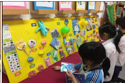
兒童節加碼活動：兌換 e 酷幣禮物