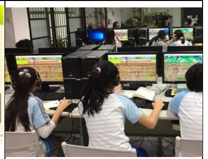
推廣 107 線上資料庫