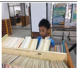
行動書車借閱是每週最開心的事