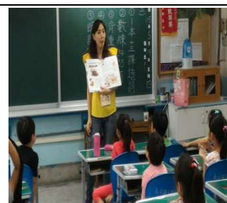
小朋友全神貫注聽愛心媽媽說故事