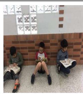
養成閱讀好習慣後，下課時間更是閱讀的好時機