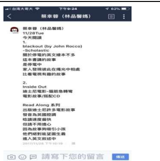
品馨媽媽在班級 LINE 群組中不定時推薦好書