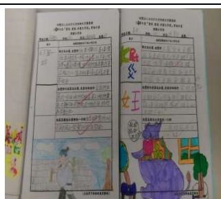
閱讀心得展現自己閱讀的成果