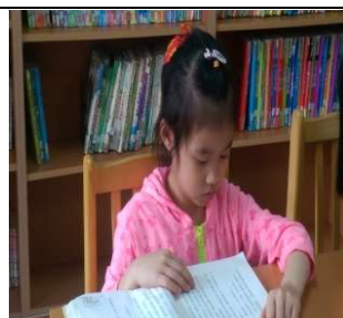
在圖書館專心閱讀的神情

(五) 行動書車資源: 每星期一次的行動書車，是孩子最開心的時間。下課 20 分鐘，孩子能快速還書，並立即找到自己喜歡的書籍立刻借閱。