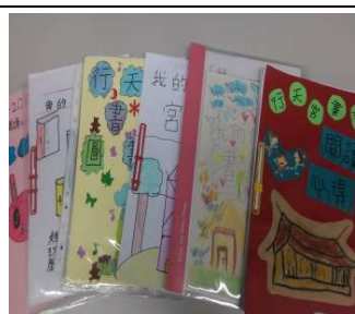
將一篇篇閱讀集結成冊

4. 閱讀實踐生命教育 :「朱子家訓」中提到「讀書志在聖賢」，老師就是要把學生教成「聖賢」，不只使他具有崇高人格，還要讓他有願意服務他人的精神。因為每天聯絡簿的一則智慧小語，孩子們寫下自己的學習心得。一來，總結自己的善行，二來，也能反省自己沒做到的部份。藉由一日日觀察自己的內心，很多孩子開始告訴我「老師，只有自己內心真正想改變才會真的改變，如果自己不想改，別人再怎麼說都沒有用。」