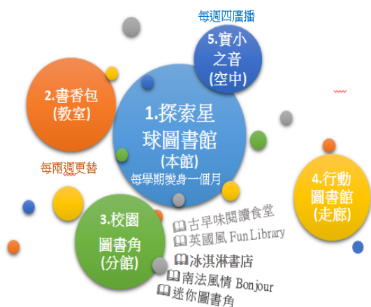
全方位立體圖書館示意圖

5. 實小之音： 志工協助製播實小之音，實小之音是由高年級同學輪流擔任主播的現場校園廣播。學生利用圖書館提供的資源設計廣播內容，內容包括「熱門主題」、「好書介紹」、「新聞報導」及「幽默一下」，在空中對全校傳播閱讀訊息。