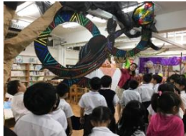
傳說巨人_女媧補天