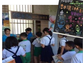
在冰淇淋分館借還書