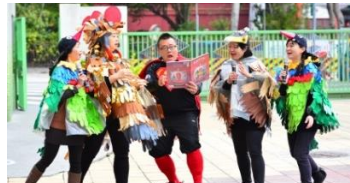
親師合演超人戲劇