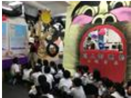
巨人的邀約 主題書展