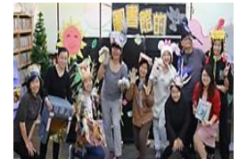
專業劇場介紹分類號