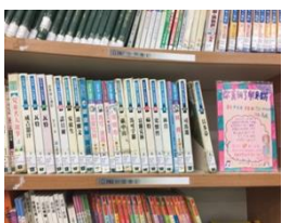
與市圖同步的分類排架