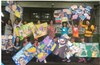
世界書香日校園說故事