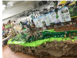
想入飛飛-鳥類生態