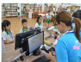
親切專業的讀者服務