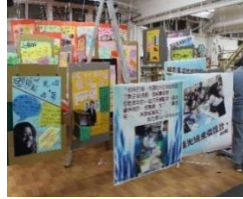
建築有樂園-建築迷宮