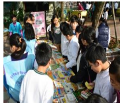
涼夏漂書日-分享心得換冰淇淋