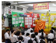
扮演唐僧生動導覽

在每一學期的主題書展組織「志工解說特攻隊」，經由培訓、觀摩、檢討，並動員志工擔任關主或小隊輔，提供主題書展最全面的解說支援。