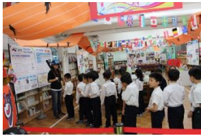
運動，熊讚！ 主題書展