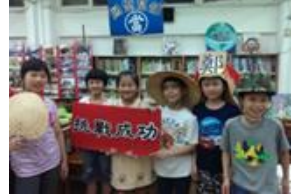
穿越歷史來講古 密室脫逃