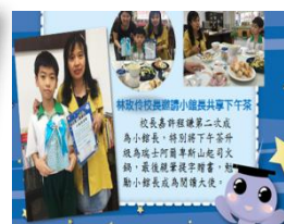
執行閱讀集點樂獎勵