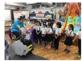
志工駕筋斗雲進行解說