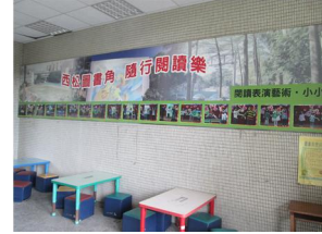
聯絡走廊設圖書角