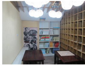
樓梯轉角設好學遊奕站

除每日中行悅書坊及北星分館的整理外，經過學校的規畫，善用校園角落空間，例如：聯絡走廊、樓梯轉角等，成立各個閱讀角落，經過志工們的努力，將各界的捐書重新整理，定期汰換，打造學生隨行閱讀樂。讓學生在課餘時間，在校園的開放空間內，隨處都有好書可讀。