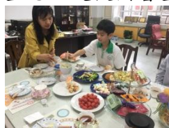
小館長和校長共享下午茶