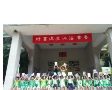
全校好書漂流活動