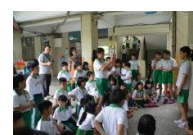
同學在圖書角說故事