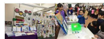
大家來破案主題書展/學生導覽自己的創作