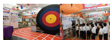
運動！熊讚主題書展/導覽運動相關書籍