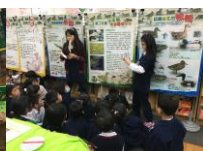
學生導覽鳥類生態