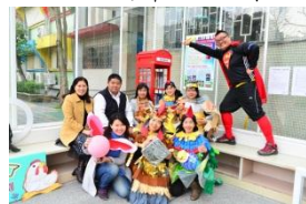
成立電話亭圖書角