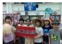
密室逃脫認識臺灣歷史