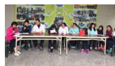
每週實小之音推廣閱讀