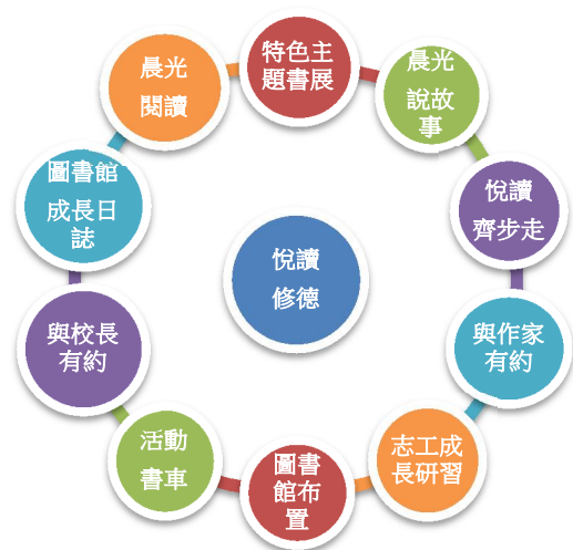
圖 1 悅讀修德方案架構圖

每週一故事組愛心志工分別進到全校各班，透過繪本生動講述、資訊融入或體驗學習等多元教學方式，只為了帶領小朋友渡過有意義的悅讀晨光。團隊運作展現絕佳的組織力，相互支援，交換心得，不斷的求新求變，非常受到小朋友的喜愛。