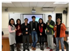
圖館輔導團的指導