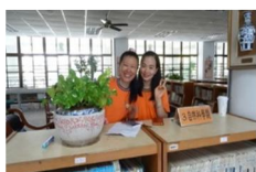
一年級圖資系戲劇