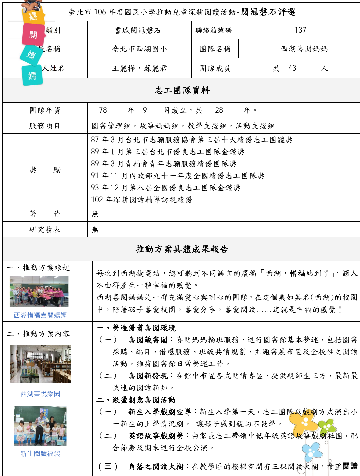
附表 4 (志工團隊專用)