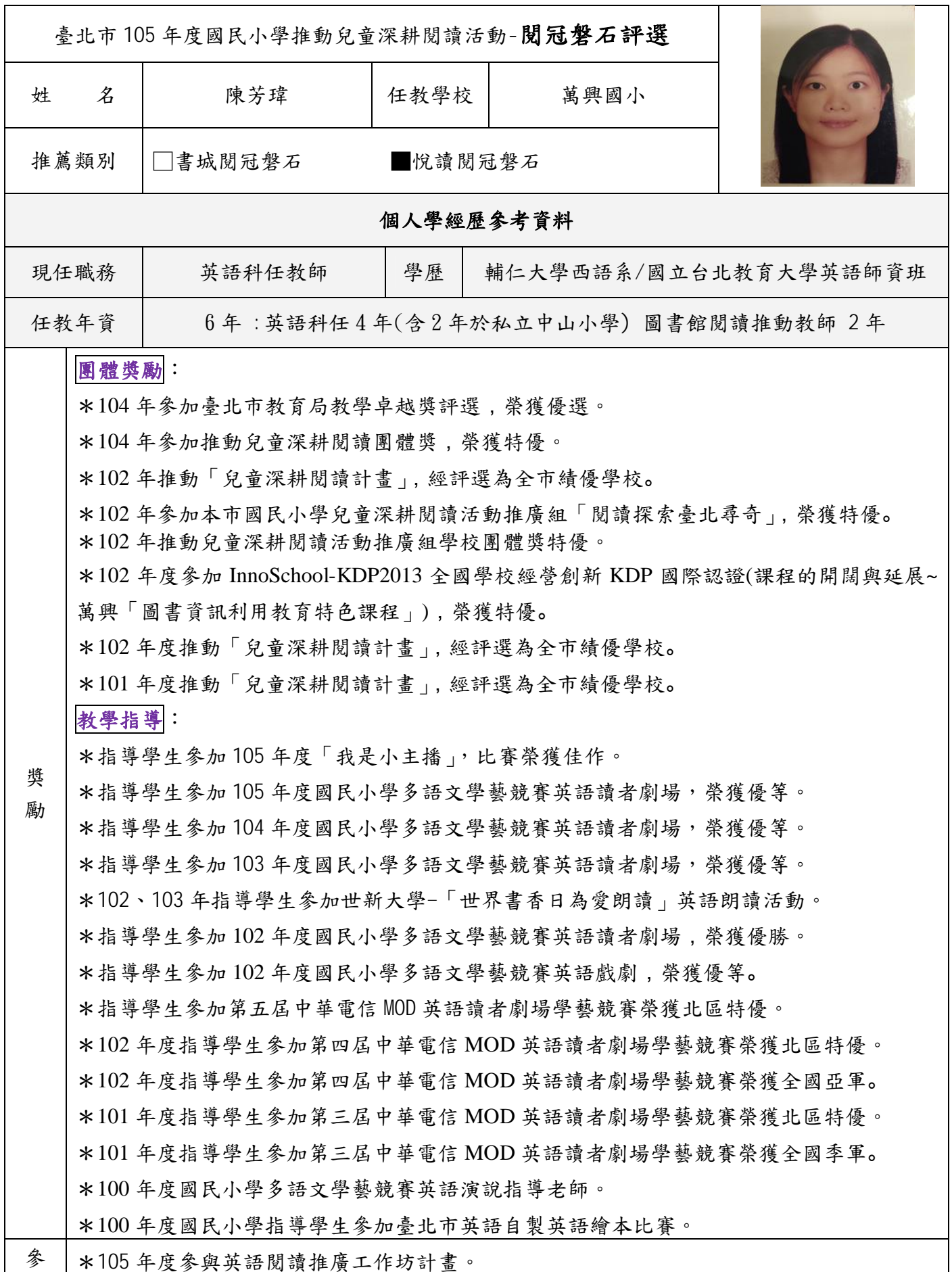
附表 3 (教師/行政人員專用)