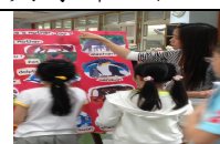
母親節英文主題書展