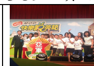
英文讀者劇場獲得全國亞軍