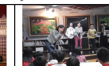
圖書館內的英文讀者劇場