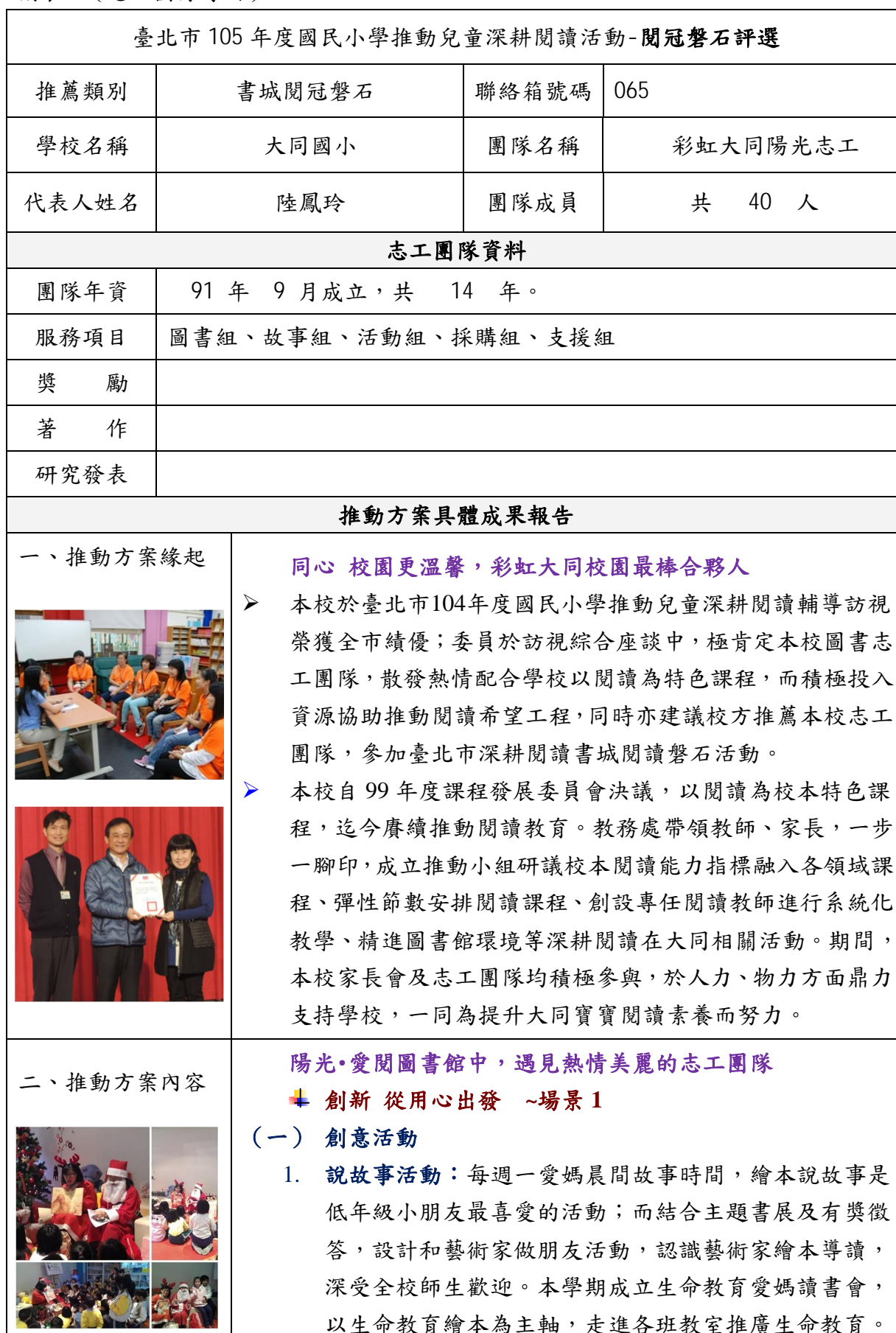
附表 4 ( 志工團隊專用 )