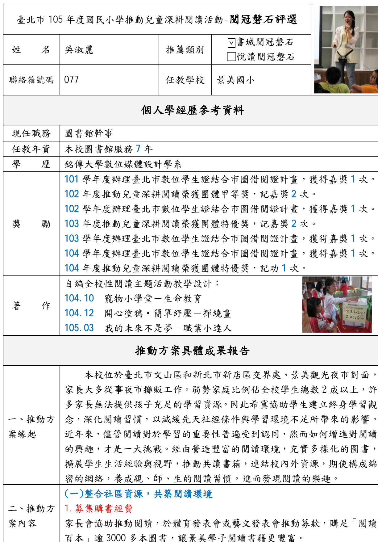
附表 3 (教師/行政人員專用)