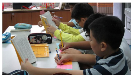
將省思寫在便利貼上