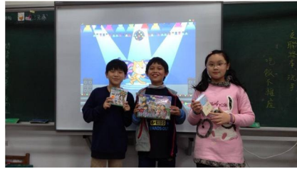
每月特推抽獎中獎學生