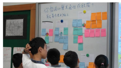
互相觀摩獲得啟發