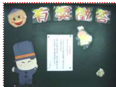
每月初公布有獎徵答題目

(三)有獎徵答：每月月初由書香媽媽參考圖書館書籍，提供三題有獎徵答題目，並於第四週週五兒童朝會公布答案及抽獎。