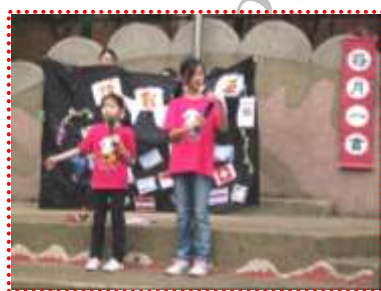
小朋友以相聲方式介紹新書

(二)每月一書：每個月的第一個星期五朝會時間，由書香媽媽挑選一本館內優良圖書，指導小朋友用戲劇演出或相聲表演等多元方式上台介紹給全校小朋友認識，圖書館外面則張貼每月一書的簡介供小朋友們參考。