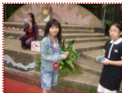
月底公布答案並進行抽獎