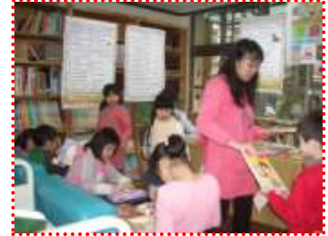
書香媽媽一起出主題書展題目