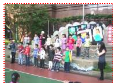
介紹完新書後一起唱跳表演

(三)有獎徵答：每月月初由書香媽媽參考圖書館書籍，提供三題有獎徵答題目，並於第四週週五兒童朝會公布答案及抽獎。