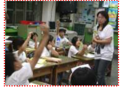
書香媽媽多元呈現導讀內容