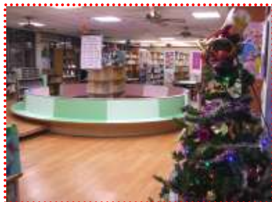
協助布置優質閱讀環境

(一)營造優質閱讀環境：書香志工們每週抽出一個半天值班，協助圖書館的館內佈置、圖書歸位與整理、新書上架、海報製作與張貼等，讓小朋友能在愉悅的環境中輕鬆自在的閱讀。