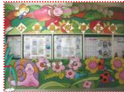
張貼及布置圖書館活動海報

(二)每月一書：每個月的第一個星期五朝會時間，由書香媽媽挑選一本館內優良圖書，指導小朋友用戲劇演出或相聲表演等多元方式上台介紹給全校小朋友認識，圖書館外面則張貼每月一書的簡介供小朋友們參考。