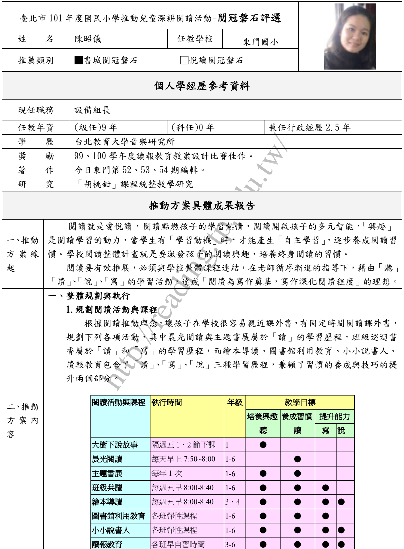
附表 3 (教師/行政人員專用)