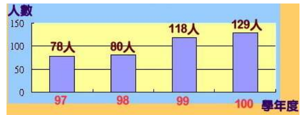
小小愛書人歷年得獎人數

4.巡迴書箱閱讀總量：自 99 學年度起，巡迴書箱之閱讀往下延伸至一年級，因此 99 學年度之後入學的小一新生，至畢業時至少可讀 106 本書。