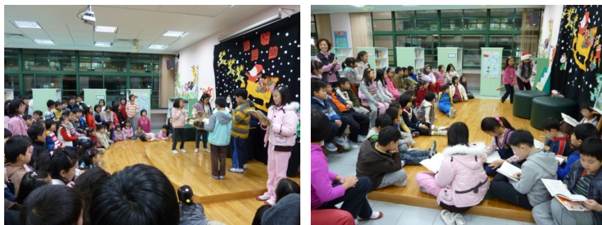
圖為聖誕老公公不來我家的七個理由圖書館演出