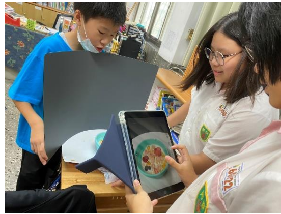
▼「一日報社」活動學生一邊查證新聞一邊進行討論與選擇▼