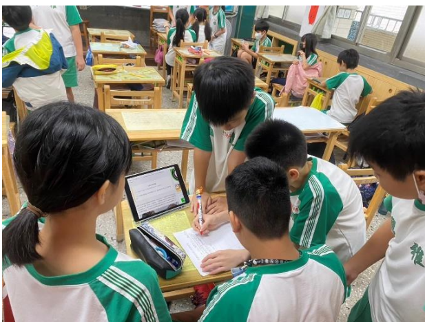
學生以平板練習上網查證假訊息 ▼