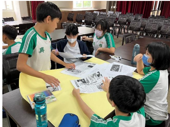
▼「報社生存戰」各組學生與報紙，並進行參觀選購▼