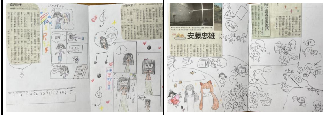
▲學生將文章繪製成連環漫畫，釐清事件的經過與順序，加深閱讀理解