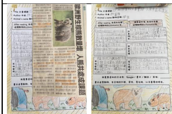
▲科普文章學習單（例一）