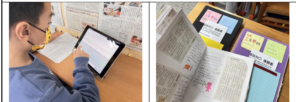
▲教室後方設置報紙區與平板電腦，供學生下課時間閱讀與查詢相關資料