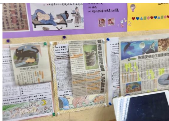
▲張貼學習單成品供全班欣賞與模仿