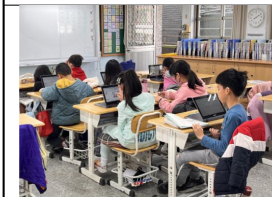
▲學生運用平板查詢並記錄補充資料