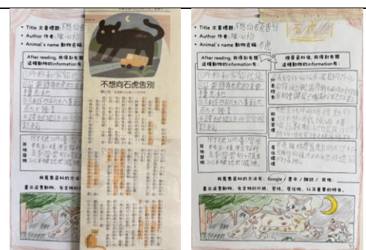
▲科普文章學習單（例二）