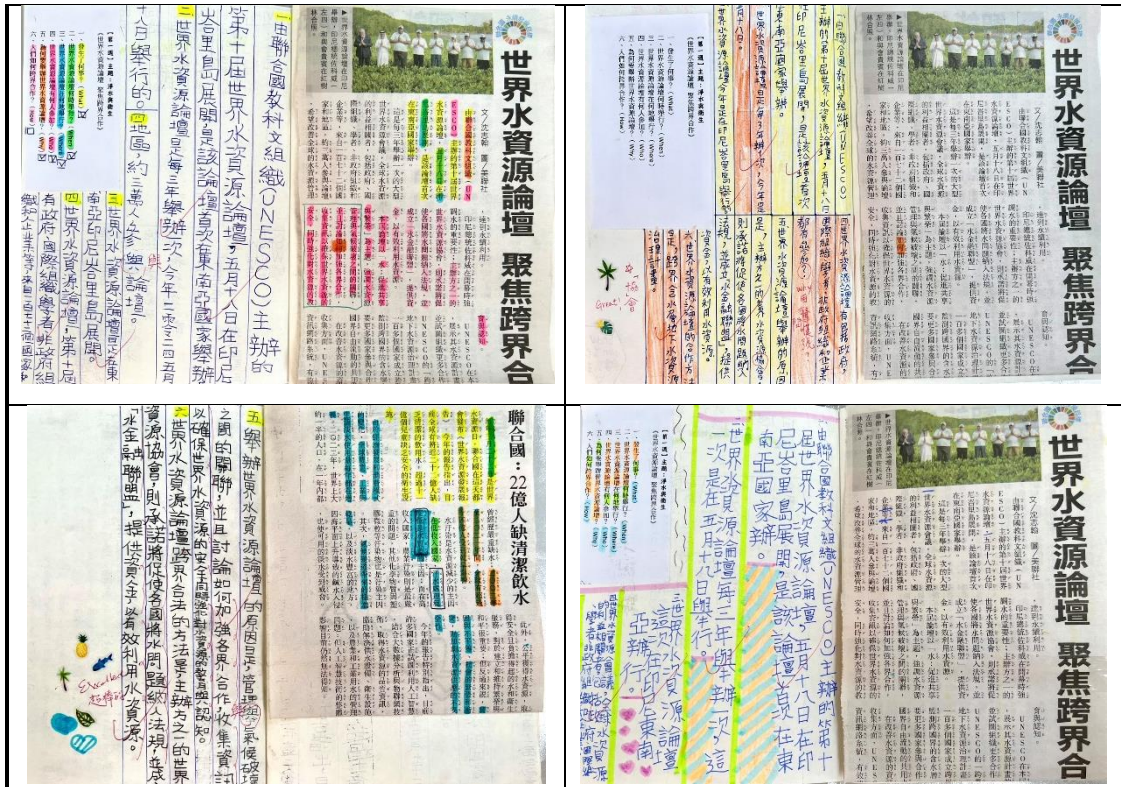
▲六何法 (5W1H) 的閱讀理解策略練習