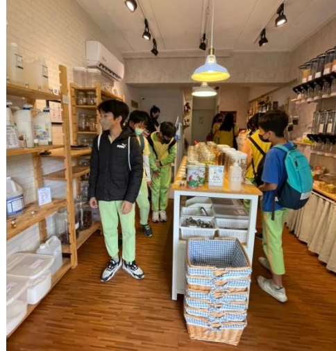
參觀社區中的環保商店-簡塑慢行(無包裝商店)