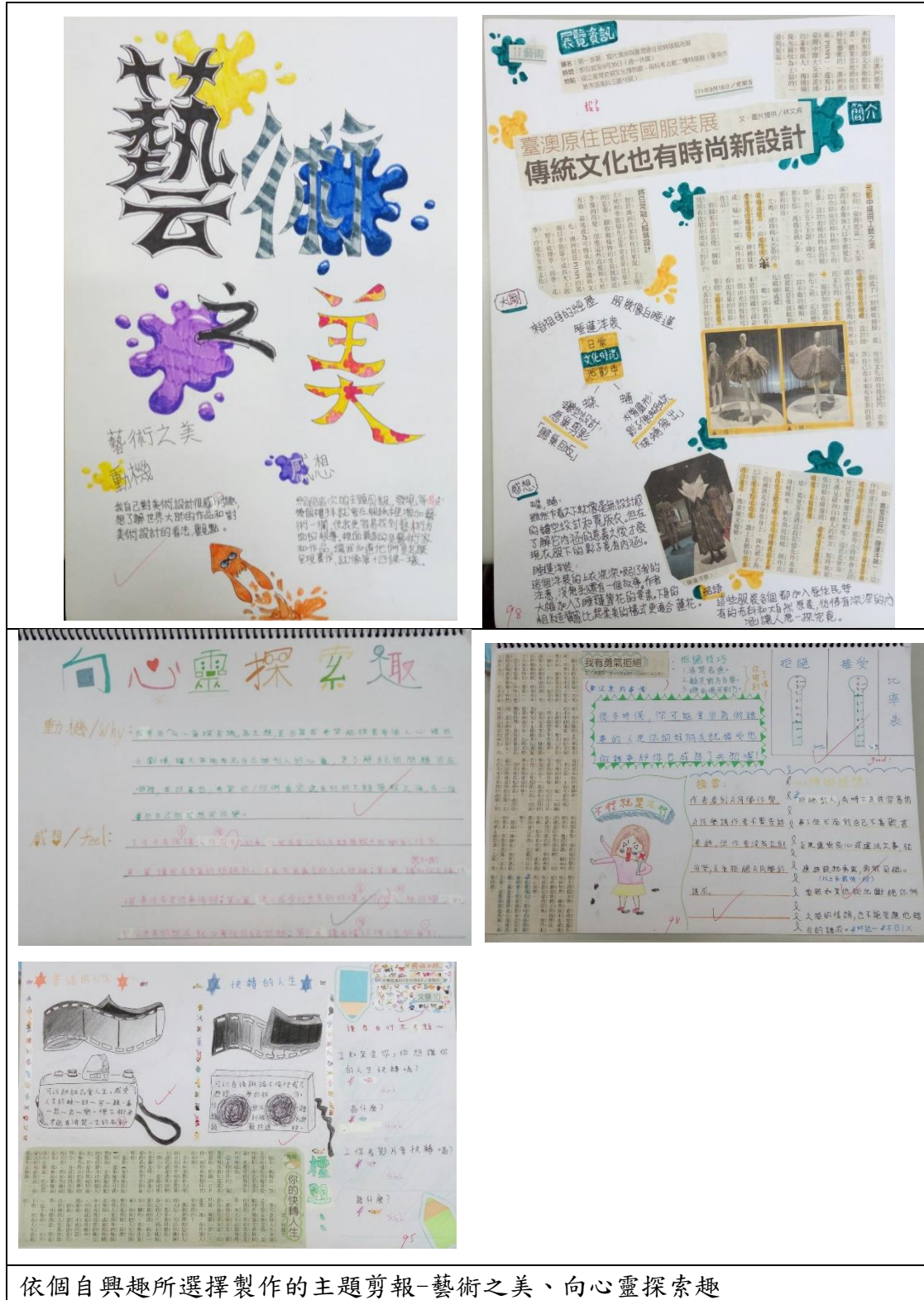
依個自興趣所選擇製作的主題剪報-藝術之美、向心靈探索趣