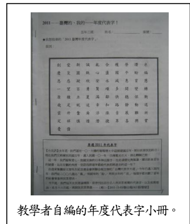
教學者自編的年度代表字小冊。

亂→盼→淡→讚，前十名代表字，前兩年充斥黑暗，這兩年散發溫暖，愛字更爬升到第二。A5 版。