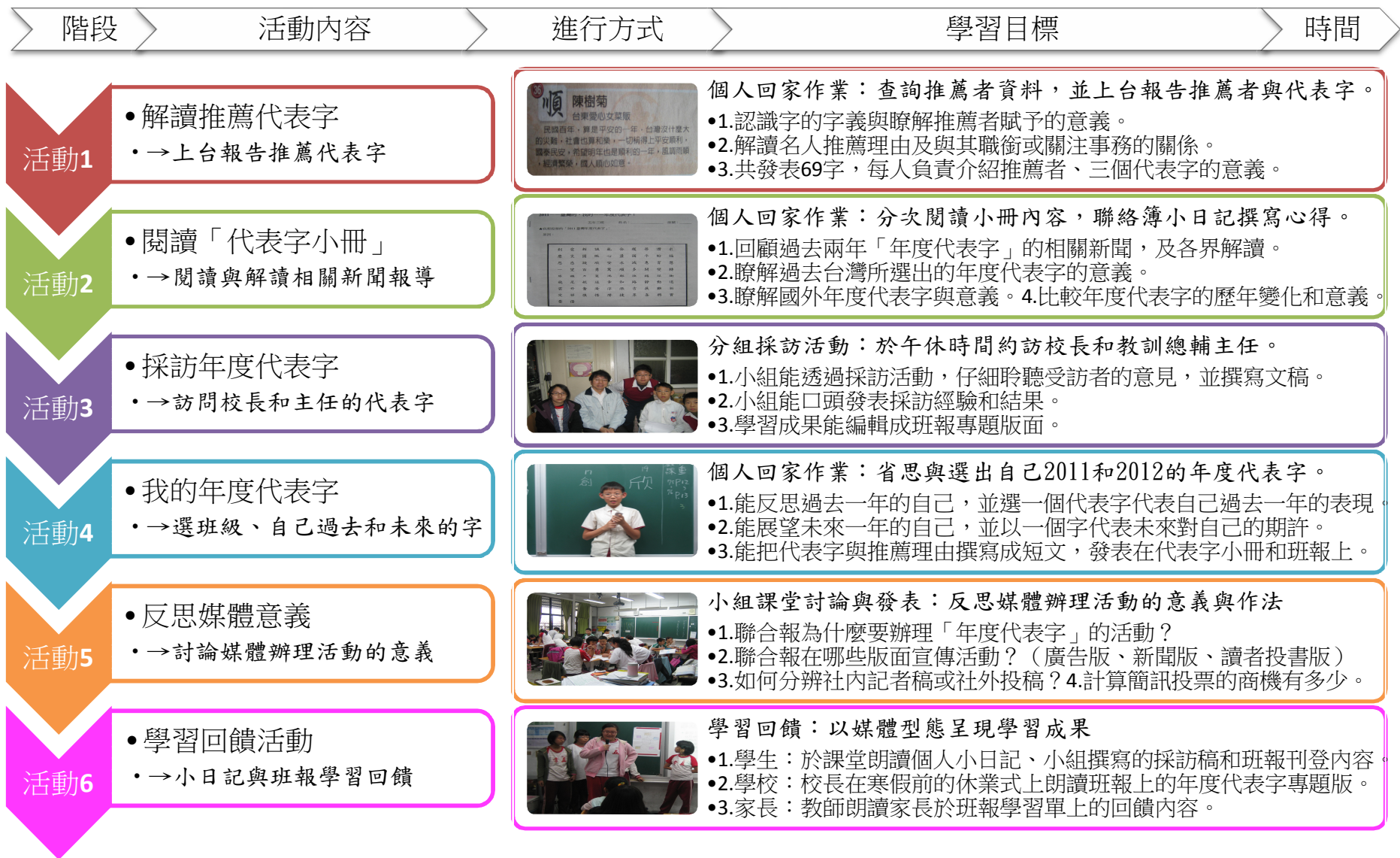
年度代表字教學架構、學習目標與流程圖