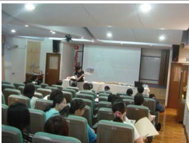
↑ 艾士老師帶領學員做手工書與對繪本的初探