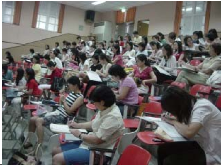
老師們認真的寫筆記