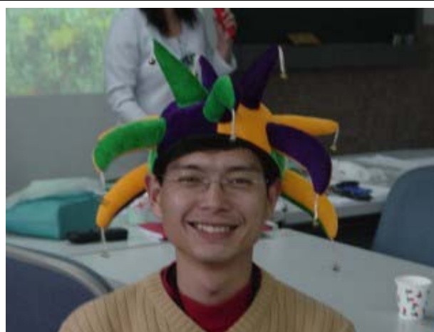
↑ 小道具可以改變團體氣氛