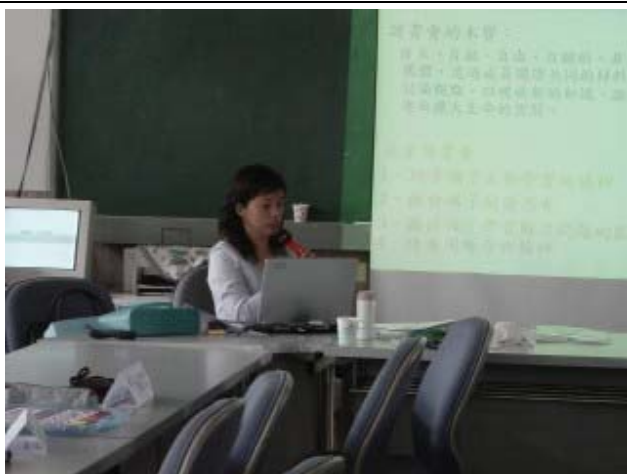
↑ 鄭老師先帶領大家看教案