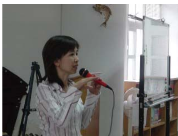
↑ 方老師回答家的問題