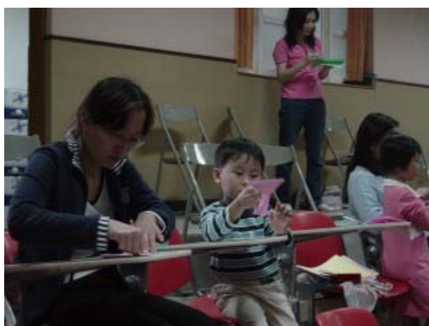
↑ 媽媽和孩子一同努力