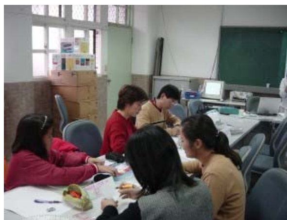
↑ 大家一起動動手，讓團體更團結