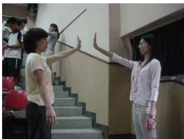
↑當我的鏡子，模仿我的動作。