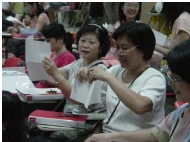
↑老師們開心的做著自己的手工書，彼此交互心得。