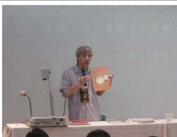
↑ 曹老師對於繪畫的熱誠與專業令人佩服