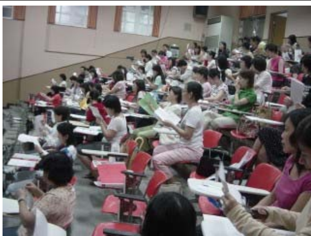
↑大家專心的聽講，深怕錯過了一個步驟