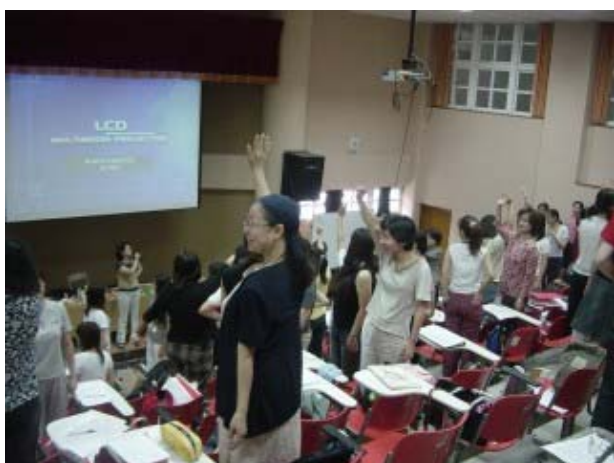
↑上課動動筋骨，也學學如何讓學生喜歡上課。